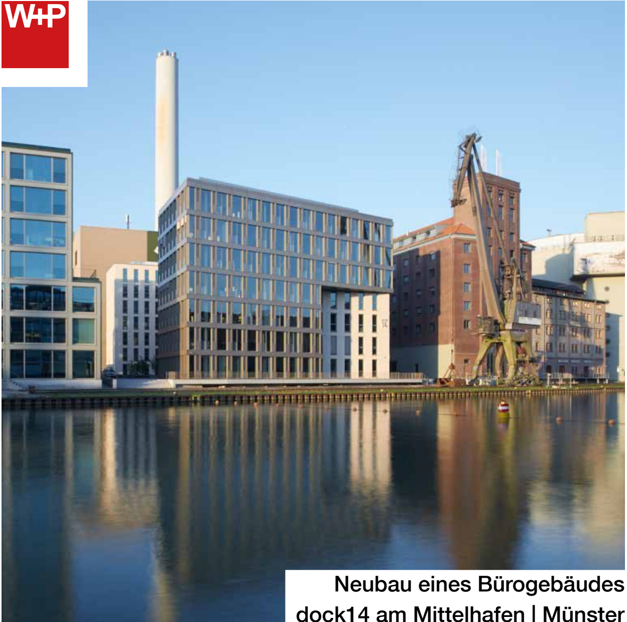
Neubau eines Bürogebäudes dock14 am Mittelhafen | Münster