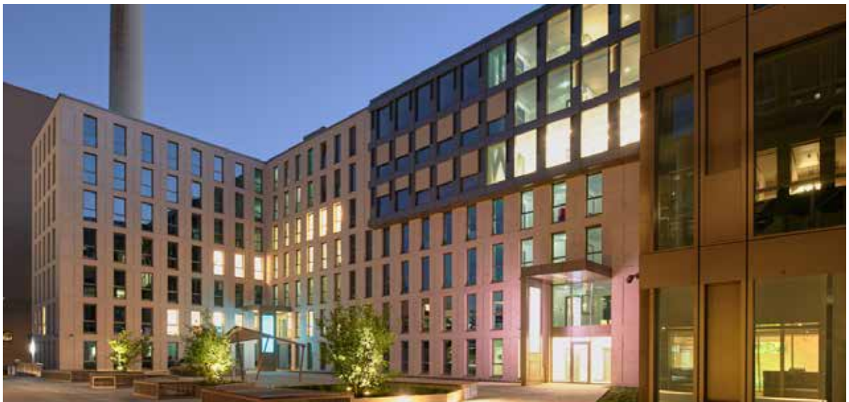
Innenhof mit Eingangsbereich