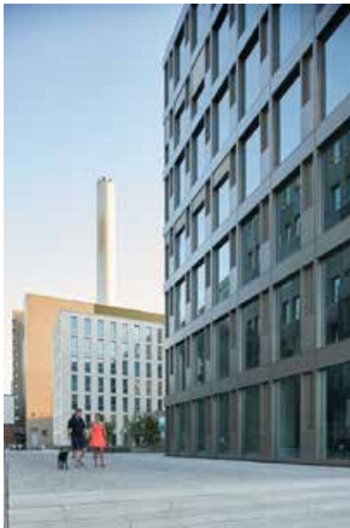
Durchgang zum Innenhof