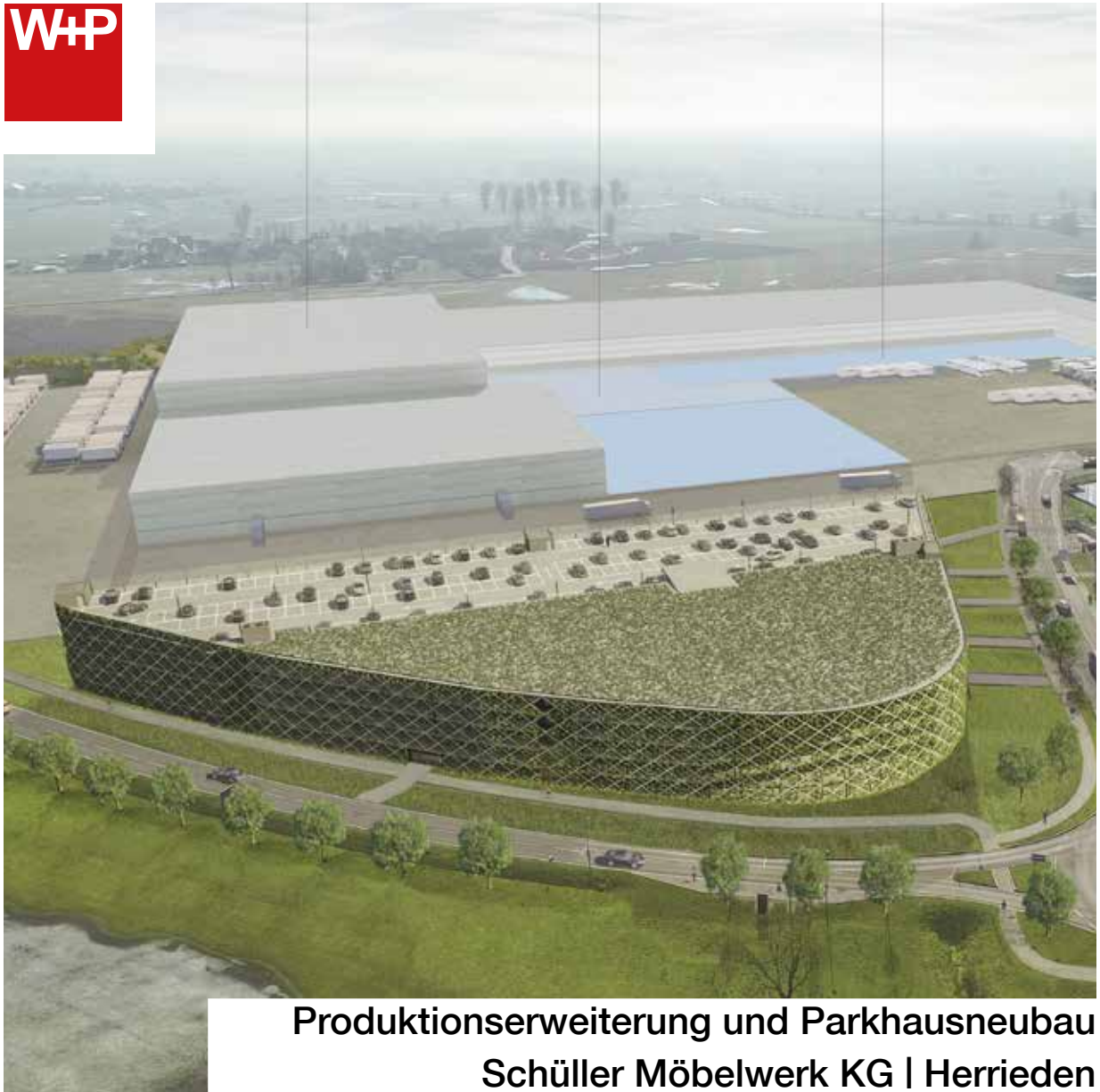
Produktionserweiterung und Parkhausneubau Schüller Möbelwerk KG | Herrieden