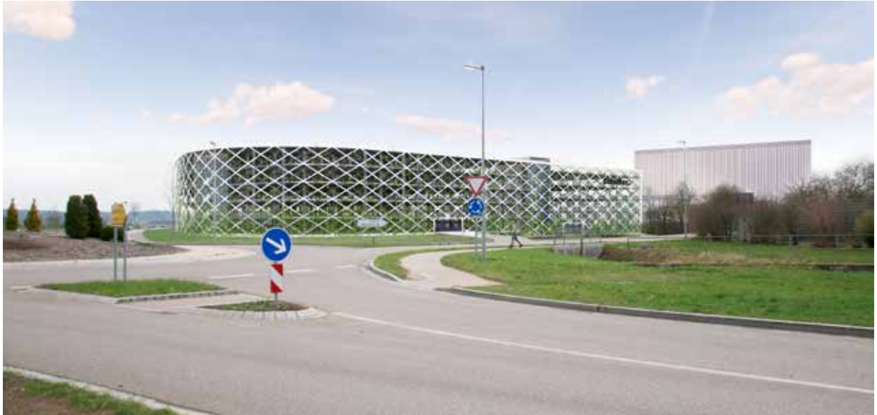
Perspektive Parkhaus | Im Hintergrund Produktions Erweiterung