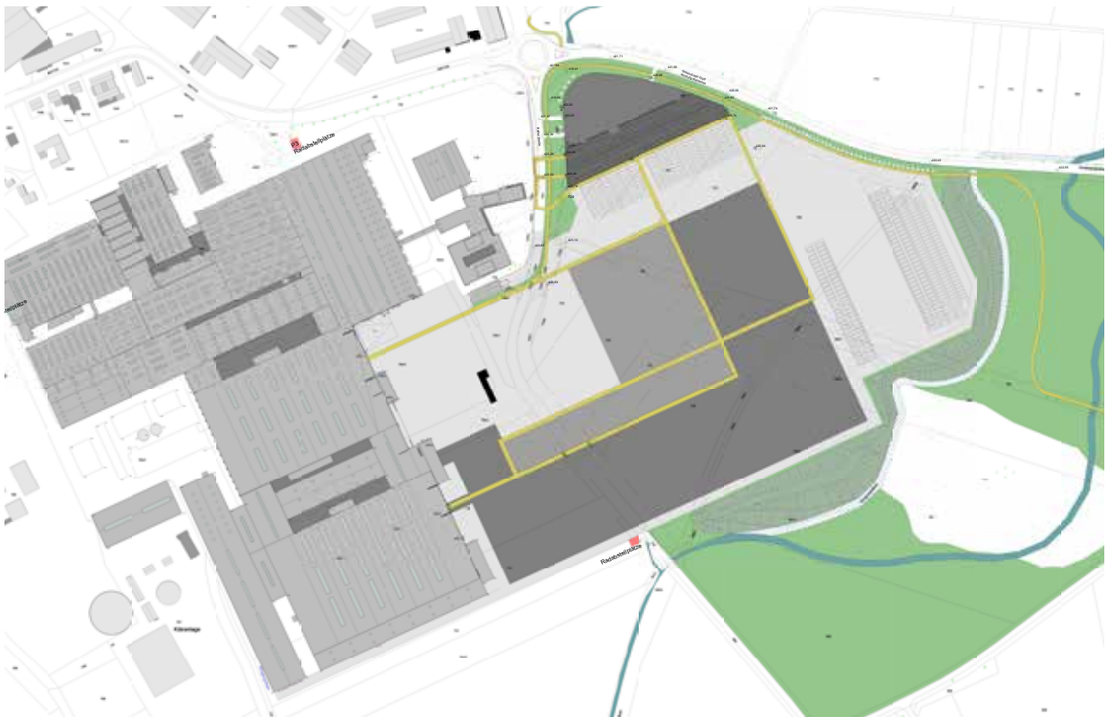
Lageplan mit Parkhaus, Erweiterung und Bestand