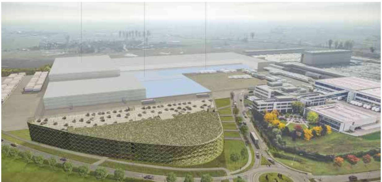
Perspektive Parkhaus, Erweiterung und Bestand